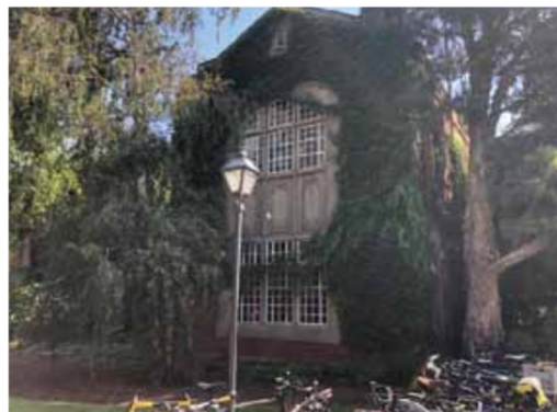
ワークショップ開催場所のメルボルン大学生命科学ビル1号館