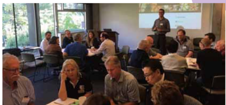
グループに分かれ、ワークショップ